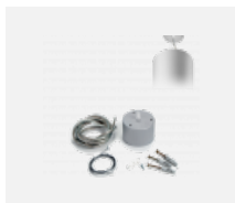
00-00398, W Seilaufhängungsset- 1 Seile 2000mm, Kabel 3x0,75mm, Baldachin