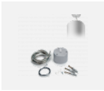
00-00398, W Seilaufhängungsset- 1 Seile 2000mm, Kabel 3x0,75mm, Baldachin