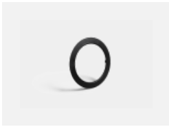
55-0001, B schwarzer Ring für Ravo