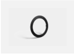
55-0001, B schwarzer Ring für Ravo