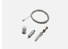
35-00300, N Seilaufhängung 2000mm