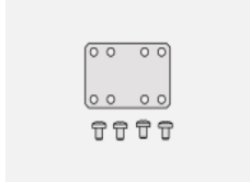
35-00200, F Direkter Verbinder