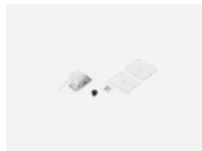
35-20101, W 2xEndkappe - Metall, Klemmleiste 5-polig, Kabeldurchführung