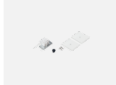
35-20101, W 2xEndkappe - Metall, Klemmleiste 5-polig, Kabeldurchführung