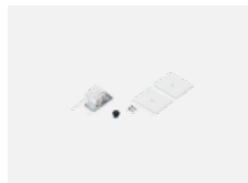
35-20101, S 2xEndkappe - Metall, Klemmleiste 5-polig, Kabeldurchführung