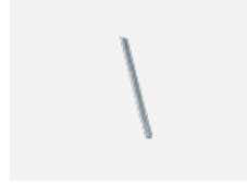
00-00363, K Kabel 5x1,5 2000mm