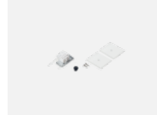
35-20101, W 2xEndkappe - Metall, Klemmleiste 5-polig, Kabeldurchführung