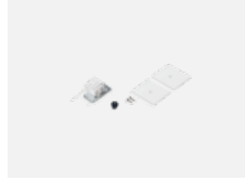
35-20101, W 2xEndkappe - Metall, Klemmleiste 5-polig, Kabeldurchführung