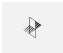
35-00101, W 2x einbauleuchte Endkappe - Metall, Klemmleiste 5-polig, Kabeldurchführung