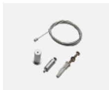
35-00300, N Seilaufhängung 2000mm