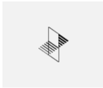
35-00111, S 2x einbauleuchte Endkappe lange - Metall, Klemmleiste 5-polig, Kabeldurchführung