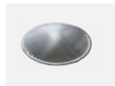
00-01101 Linear optic