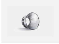
00-01002 Reflektor 32°