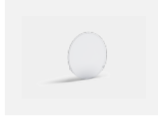
00-01100 Satinice diffuser