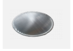
00-01101 Linear optic