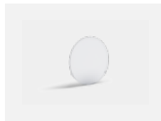
00-01100 Satinice diffuser