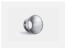
00-01002 Reflektor 32°