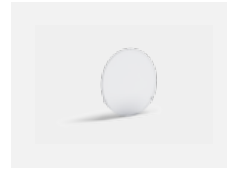
00-01100 Satinice diffuser