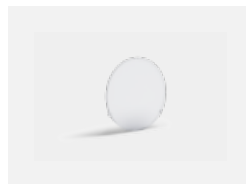
00-01100 Satinice diffuser