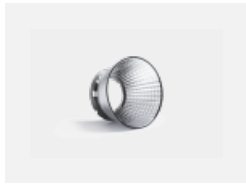
00-01002 Reflektor 32°