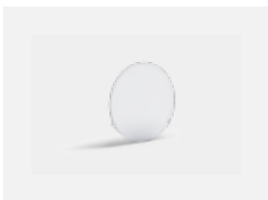
00-01100 Satinice diffuser