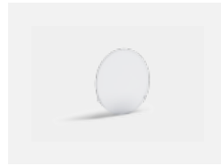
00-01100 Satinice diffuser