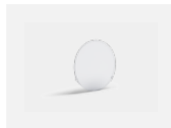
00-01100 Satinice diffuser