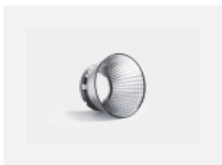
00-01002 Reflektor 32°