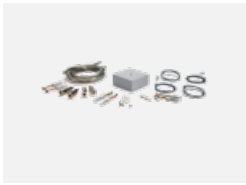
00-00333, S Seilaufhängungsset- 4 Seile 2000mm, Kabel 5x0,75mm, Baldachin