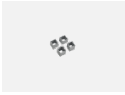
19-0009, W Distanzteile für Quadratleuchten und Rundleuchten Ø 370 mm