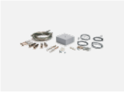
00-00333, W Seilaufhängungsset- 4 Seile 2000mm, Kabel 5x0,75mm, Baldachin