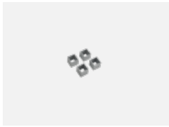
19-0009, W Distanzteile für Quadratleuchten und Rundleuchten Ø 370 mm