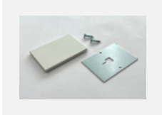
145-50102, B 2 x Metall-Endkappe ohne Schrauben