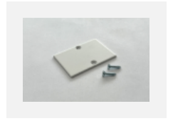
145-50101, B 2 x Metall-Endkappe mit Schrauben