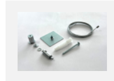
145-50302, N Seile 6000mm + Metallhalter;