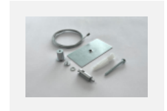
145-50303, N Seile an Profilverbindung 2000mm - 1 Stk. + Metallhalter