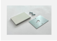
145-50102, B 2 x Metall-Endkappe ohne Schrauben