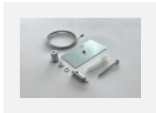
145-50304, N Seile an Profilverbindung 4000mm - 1 Stk. + Metallhalter