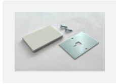
145-50102, W 2 x Metall-Endkappe ohne Schrauben