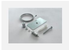
145-50305, N Seile an Profilverbindung 6000mm - 1 Stk. + Metallhalter