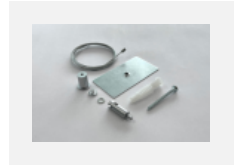
145-50303, N Seile an Profilverbindung 2000mm - 1 Stk. + Metallhalter