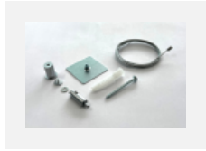
145-50300, N Seile 2000mm + Metallhalter;