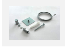
145-50302, N Seile 6000mm + Metallhalter;