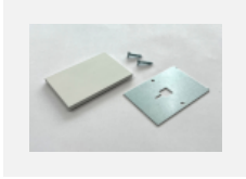
145-50102, S 2 x Metall-Endkappe ohne Schrauben