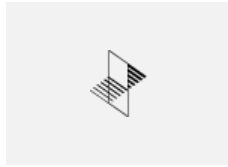
145-20700, S Wandhalter (2 Stk) Lina45