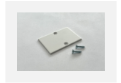
145-50101, W 2 x Metall-Endkappe mit Schrauben