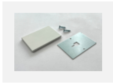
145-50102, B 2 x Metall-Endkappe ohne Schrauben