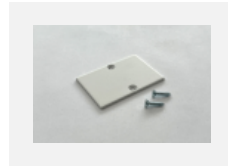
145-50101, S 2 x Metall-Endkappe mit Schrauben