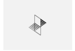
145-01200, F Zubehör für Demontage El. Modules für Lina145