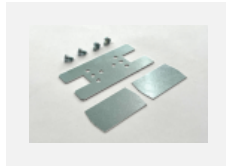
145-50200, F direkter Veerbinder mit Abdeckung