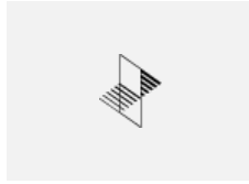
145-20700, S Wandhalter (2 Stk) Lina45