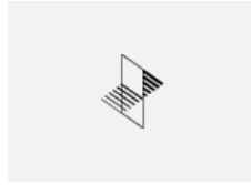
145-20700, W Wandhalter (2 Stk) Lina45