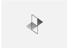
145-01200, F Zubehör für Demontage El. Modules für Lina145