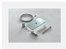
145-50305, N Seile an Profilverbindung 6000mm - 1 Stk. + Metallhalter