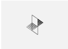
145-20700, W Wandhalter (2 Stk) Lina45