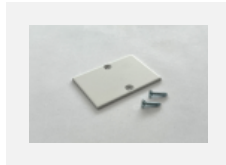
145-50101, B 2 x Metall-Endkappe mit Schrauben