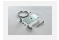
145-50303, N Seile an Profilverbindung 2000mm - 1 Stk. + Metallhalter