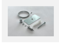
145-50304, N Seile an Profilverbindung 4000mm - 1 Stk. + Metallhalter