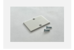
145-50101, B 2 x Metall-Endkappe mit Schrauben