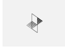
145-20700, W Wandhalter (2 Stk) Lina45