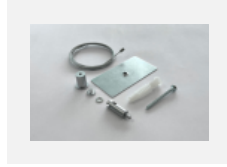
145-50305, N Seile an Profilverbindung 6000mm - 1 Stk. + Metallhalter