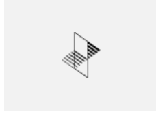
145-01200, F Zubehör für Demontage El. Modules für Lina145