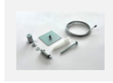
145-50300, N Seile 2000mm + Metallhalter;