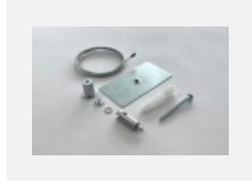
145-50303, N Seile an Profilverbindung 2000mm - 1 Stk. + Metallhalter