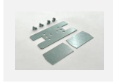
145-50200, F direkter Veerbinder mit Abdeckung