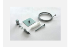
145-50301, N Seile 4000mm + Metallhalter;