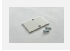
145-50101, W 2 x Metall-Endkappe mit Schrauben