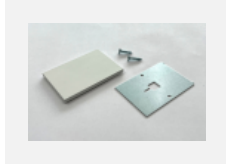
145-50102, B 2 x Metall-Endkappe ohne Schrauben