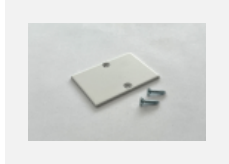
145-50101, W 2 x Metall-Endkappe mit Schrauben