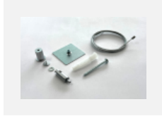
145-50302, N Seile 6000mm + Metallhalter;