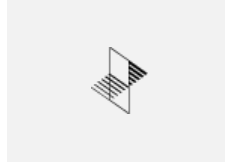
145-20700, S Wandhalter (2 Stk) Lina45