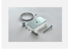
145-50304, N Seile an Profilverbindung 4000mm - 1 Stk. + Metallhalter