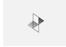
145-20700, W Wandhalter (2 Stk) Lina45