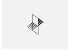
145-20700, B Wandhalter (2 Stk) Lina45