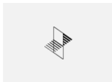
145-20700, S Wandhalter (2 Stk) Lina45