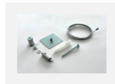
145-50301, N Seile 4000mm + Metallhalter;