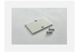
145-50101, W 2 x Metall-Endkappe mit Schrauben