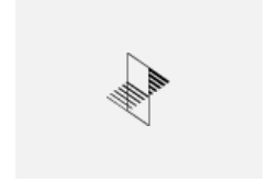
145-01200, F Zubehör für Demontage El. Modules für Lina145