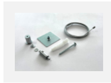
145-50301, N Seile 4000mm + Metallhalter;