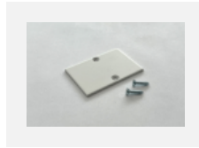
145-50101, B 2 x Metall-Endkappe mit Schrauben