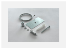
145-50305, N Seile an Profilverbindung 6000mm - 1 Stk. + Metallhalter