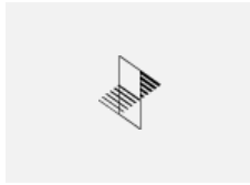
145-20700, W Wandhalter (2 Stk) Lina45