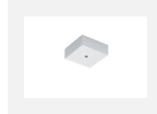
00-00370, W Deckenkappe 80x80x32mm