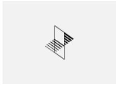
145-20700, B Wandhalter (2 Stk) Lina45