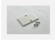
145-50101, W 2 x Metall-Endkappe mit Schrauben