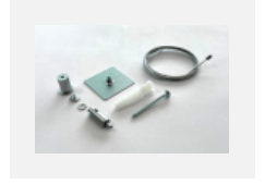
145-50301, N Seile 4000mm + Metallhalter;