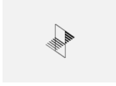
145-20700, B Wandhalter (2 Stk) Lina45