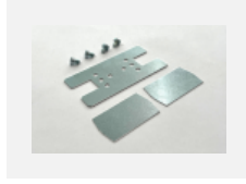
145-50200, F direkter Veerbinder mit Abdeckung