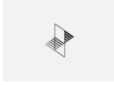
145-20700, S Wandhalter (2 Stk) Lina45