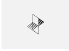
145-01200, F Zubehör für Demontage El. Modules für Lina145