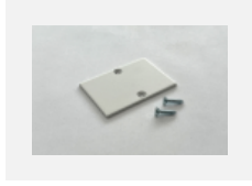
145-50101, S 2 x Metall-Endkappe mit Schrauben