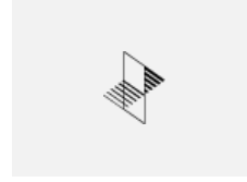
145-20700, W Wandhalter (2 Stk) Lina45