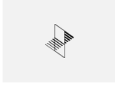
145-20700, B Wandhalter (2 Stk) Lina45