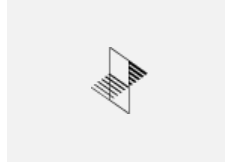
145-20700, S Wandhalter (2 Stk) Lina45