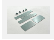
145-50200, F direkter Veerbinder mit Abdeckung