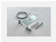
145-50305, N Seile an Profilverbindung 6000mm - 1 Stk. + Metallhalter