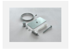
145-50303, N Seile an Profilverbindung 2000mm - 1 Stk. + Metallhalter