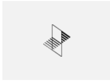
145-20700, S Wandhalter (2 Stk) Lina45