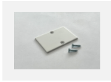
145-50101, S 2 x Metall-Endkappe mit Schrauben