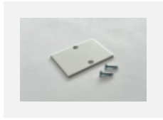
145-50101, W 2 x Metall-Endkappe mit Schrauben