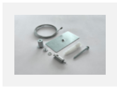
145-50304, N Seile an Profilverbindung 4000mm - 1 Stk. + Metallhalter