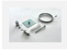
145-50300, N Seile 2000mm + Metallhalter;