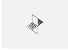
145-20700, B Wandhalter (2 Stk) Lina45