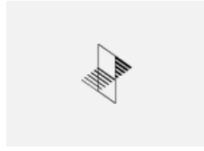
145-20700, W Wandhalter (2 Stk) Lina45