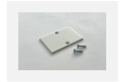
145-50101, W 2 x Metall-Endkappe mit Schrauben