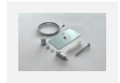
145-50303, N Seile an Profilverbindung 2000mm - 1 Stk. + Metallhalter