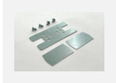
145-50200, F direkter Veerbinder mit Abdeckung