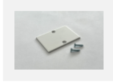
145-50101, W 2 x Metall-Endkappe mit Schrauben