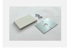
145-50102, S 2 x Metall-Endkappe ohne Schrauben