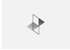
145-01200, F Zubehör für Demontage El. Modules für Lina145