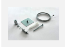
145-50300, N Seile 2000mm + Metallhalter;