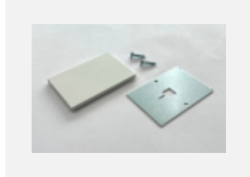
145-50102, S 2 x Metall-Endkappe ohne Schrauben