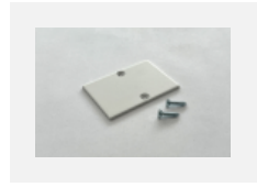
145-50101, S 2 x Metall-Endkappe mit Schrauben