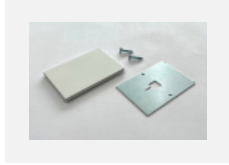
145-50102, S 2 x Metall-Endkappe ohne Schrauben