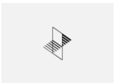
145-20700, S Wandhalter (2 Stk) Lina45