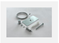
145-50304, N Seile an Profilverbindung 4000mm - 1 Stk. + Metallhalter