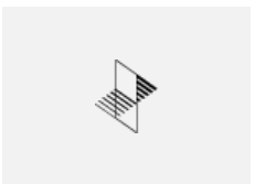
145-20700, B Wandhalter (2 Stk) Lina45