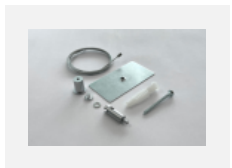
145-50303, N Seile an Profilverbindung 2000mm - 1 Stk. + Metallhalter