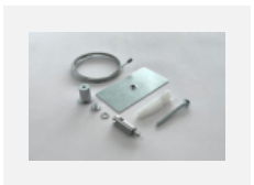
145-50305, N Seile an Profilverbindung 6000mm - 1 Stk. + Metallhalter