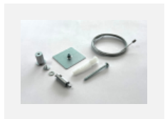
145-50301, N Seile 4000mm + Metallhalter;