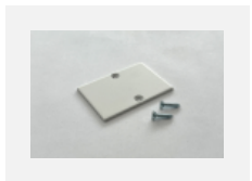
145-50101, W 2 x Metall-Endkappe mit Schrauben