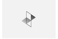
145-01200, F Zubehör für Demontage El. Modules für Lina145