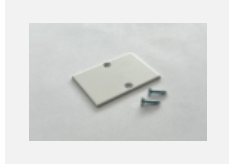
145-50101, S 2 x Metall-Endkappe mit Schrauben