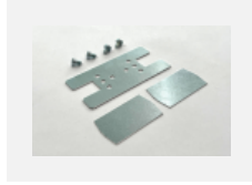
145-50200, F direkter Veerbinder mit Abdeckung