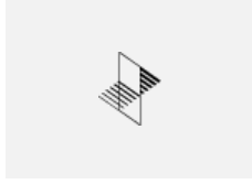
145-20700, B Wandhalter (2 Stk) Lina45