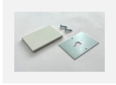
145-50102, B 2 x Metall-Endkappe ohne Schrauben