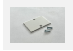
145-50101, B 2 x Metall-Endkappe mit Schrauben